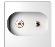
Gas & Air Connections