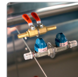
Gas & Air Valve